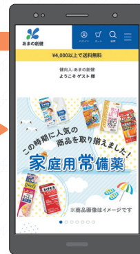
ゲストユーザーでログイン完了